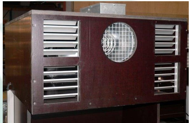
Absaugereinheit mit Heizgerät und Ventilen.