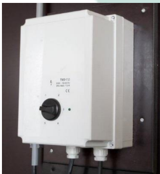
Gebläse mit 5-stufigem Geschwindigkeitsregler.