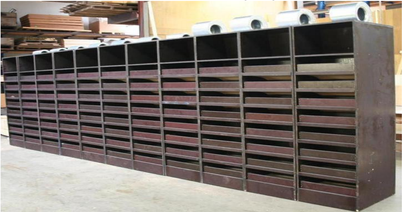
Trocknungs-/Belüftungseinheiten für Schubladen.

Schubladentrockner für kleine Saatgutmengen