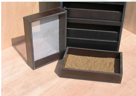
Schubladen mit Netzunterseite.