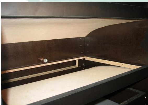
Lufteinlass und Luftführung pro Schublade.