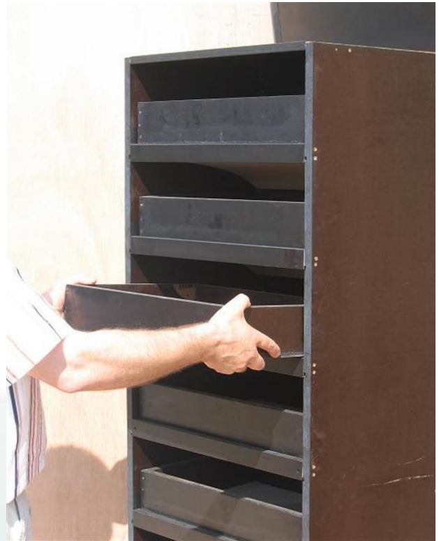
Lufteinlass öffnet sich, wenn die Schublade eingesetzt wird.