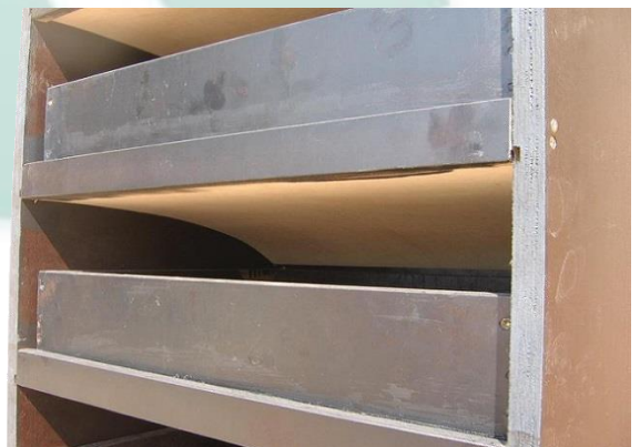
Individueller Lufteinlass und -auslass pro Schublade.