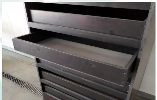
Einfache Positionierung der Schublade im Trockner.