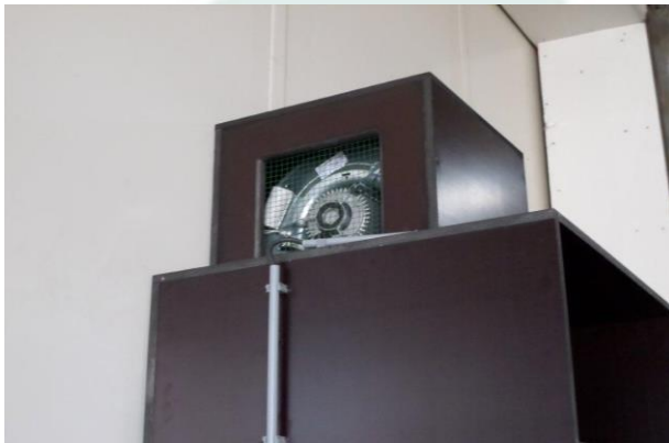
Zentrifugalgebläse zum Absaugen der klimatisierten Luft, die durch das Saatgut geblasen wird.